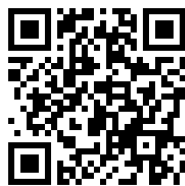
本書 PDF file

ご注意 本機は同人ハードウェアです。出荷前に MSX で動作確認していますが、使用するレトロ PC によっては動作しないことがあります。アフターサポートはありませんのでご了承の上でお求めください。ご使用には送信機が必要です。